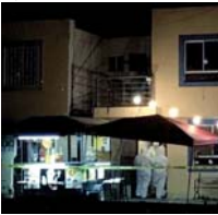
CD. BENTO JUÁREZ, N. L.

Dos de las víctimas eran prófugos del Cereso de Apodaca desde el 2012