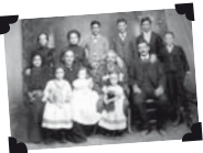
FOTO DEL RECUERDO