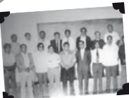
FOTO DEL RECUERDO

Integrantes del Patronato Pro Preparatoria # 12 en 30 de agosto de 1972... ¿A quien reconocer usted?